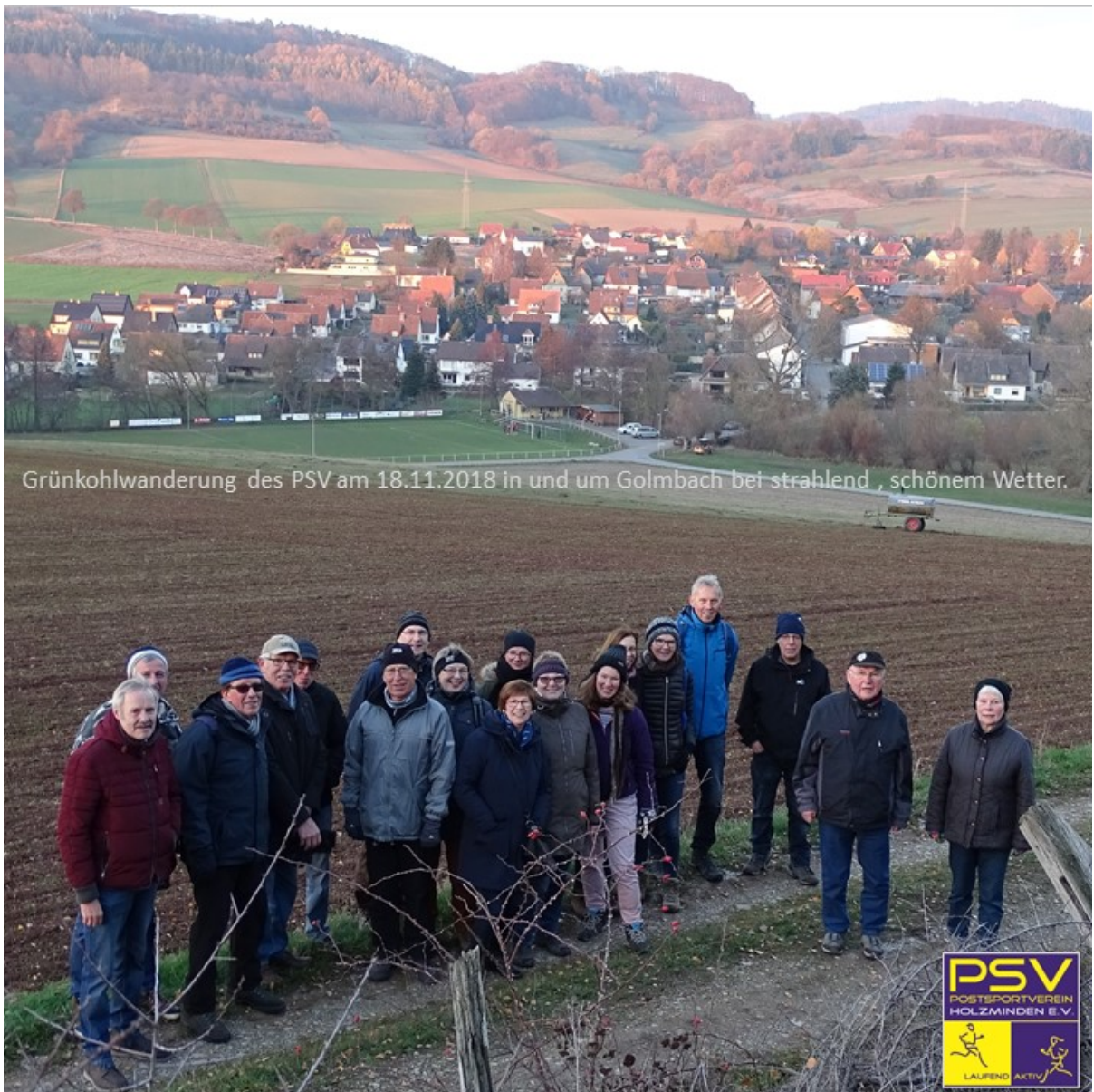
Grünkohlwanderung des PSV am 18.11.2018 in und um Golmbach bei strahlend , schönem Wetter.