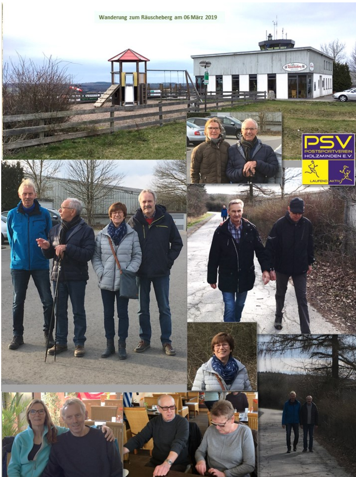
Wanderung zum Räuscheberg am 06 März 2019